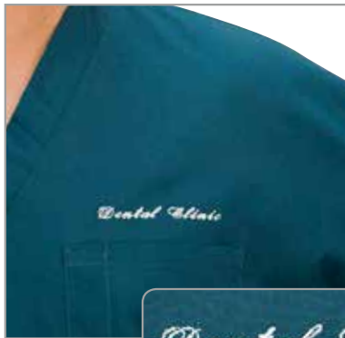
例4 「Dental Clinic」