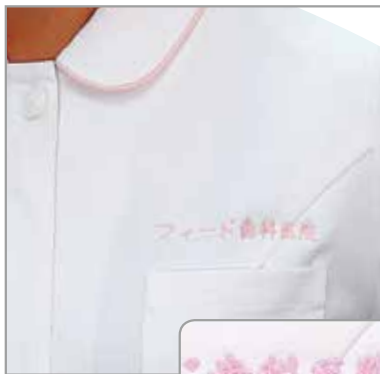
例1 「フィード歯科医院」