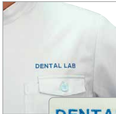
例5 「DENTAL LAB」