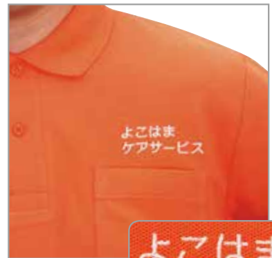
例3 「よこはま ケアサービス」